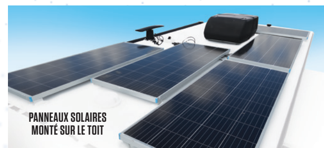
PANNEAUX SOLAIRES MONTÉ SUR LE TOIT